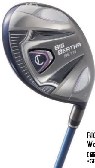
BIG BERTHA BETA Women's フェアウェイウッド

【価格】 ・GP for BIG BERTHA (A, L) ¥50,000+税