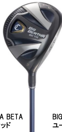
BIG BERTHA BETA フェアウェイウッド

【価格】 ・GP for BIG BERTHA (S, SR, R, R2) ¥88,000+税 ・Tour AD GP-5 (SR, R) ・Speeder EVOLUTION II 569 (SR, R) ¥105,000+税