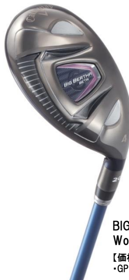
BIG BERTHA BETA Women's ユーティリティ

【価格】 ・GP for BIG BERTHA (A, L) ¥38,000+税