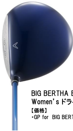
BIG BERTHA BETA Women's ドライバー

ドライバー、フェアウェイウッド 2016年4月下旬発売予定 ユーティリティ、アイアン 2016年5月中旬発売予定