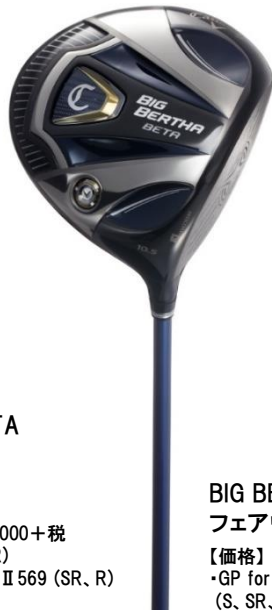
BIG BERTHA BETA ドライバー

【価格】 ・GP for BIG BERTHA (S, SR, R, R2) ¥88,000+税 ・Tour AD GP-5 (SR, R) ・Speeder EVOLUTION II 569 (SR, R) ¥105,000+税