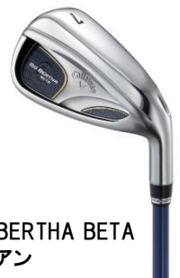
BIG BERTHA BETA アイアン

【価格】 ・GP for BIG BERTHA (S, SR, R, R2) ¥38,000+税