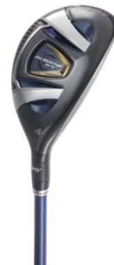
BIG BERTHA BETA ユーティリティ

【価格】 ・GP for BIG BERTHA (S, SR, R, R2) ¥50,000+税